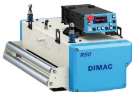
DIMAC R50 - SCHEDA TECNICA